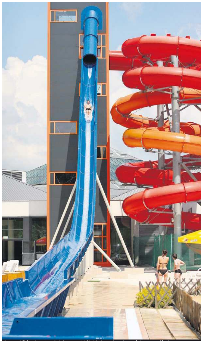
Aquapark Fala zainwestował niedawno w zjeżdżalnię, teraz chce otworzyć zimową część całoroczną