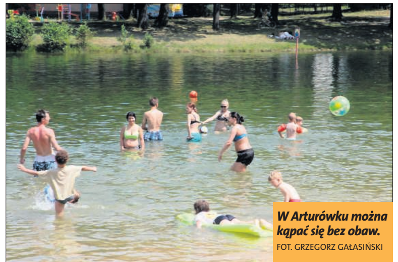
W Arturówku można kąpać się bez obaw.

zbiorniku górnym, czyli z tego 3,5 tys. ze zbiornika górnego, 3 tys. z dolnego (kąpieliska)