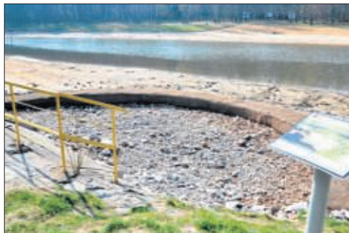
Tak wyglądają budowle z dolomitu zatrzymujące zanieczyszczenia.

Podczas oczyszczania z dna wszystkich zbiorników wywieziono ponad 9 tys. metrów sześciennych namułu,